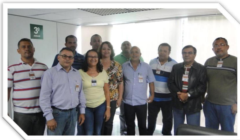
GT Racionalização (Representante do SINASEFE e Fasubra)

O SINASEFE participou da primeira reunião do ano de 2013 do Grupo de Trabalho para Racionalização de Cargos no PCCTAE e sobre a Terceirização nos IFs no último dia 29.